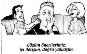
Çözüm önerilerimiz: iyi iletişim, doğru yaklaşım.

Motivasyonun sağlanmasında ailenin rolü genci anlamaktır ve bunu ona hissettirmektir. Örneğin; "Hem okulu hem de dershaneyi birlikte götürmenin zor ve yorucu olduğunu biliyorum ve bu zor dönemde senin yanımdayım ve benden istediğin desteği vermeye hazırım." tarzında konuşmalar gencin motivasyonunu arttıracaktır.